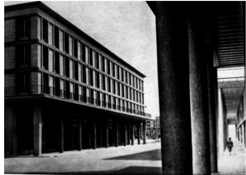
Abb. 4: Auguste Perret, Rue de Paris in Le Havre, 1945-50. Kolonnaden und tektonisch gegliederte Fassaden formen eine modernisierte Version des französischen Klassizismus und der Rue de Rivoli in Stahlbeton.