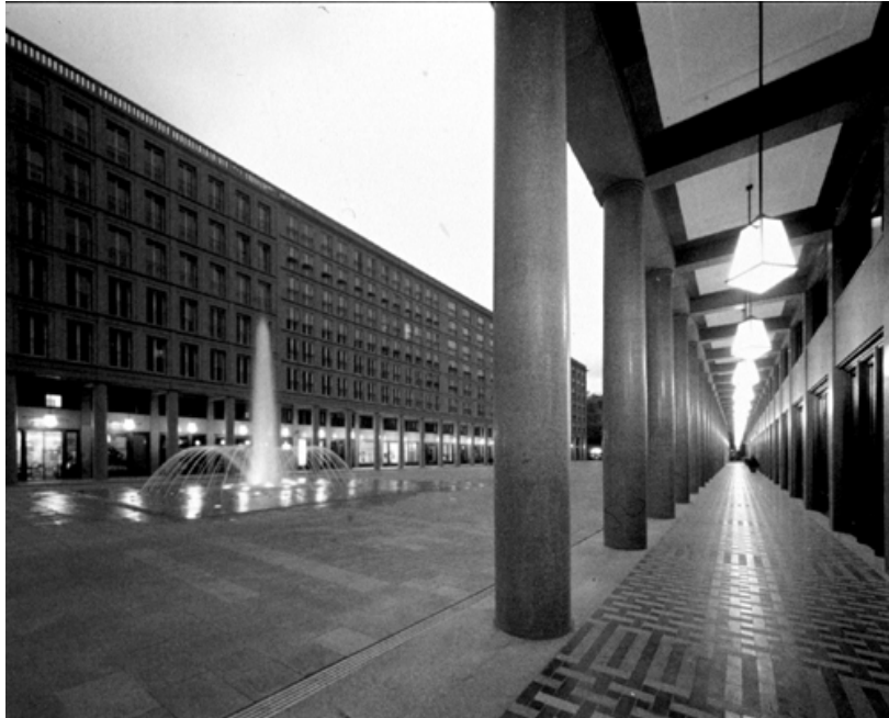
Abb. 5: Hans Kollhoff, Walter-Benjamin-Platz in Berlin, 1995-2001. Der Archetyp der Kolonnadenstraße ist hier zum Platz umgedeutet, tektonisch gegliederte Fassaden knüpfen an lokale klassizistische Stadtarchitektur an.