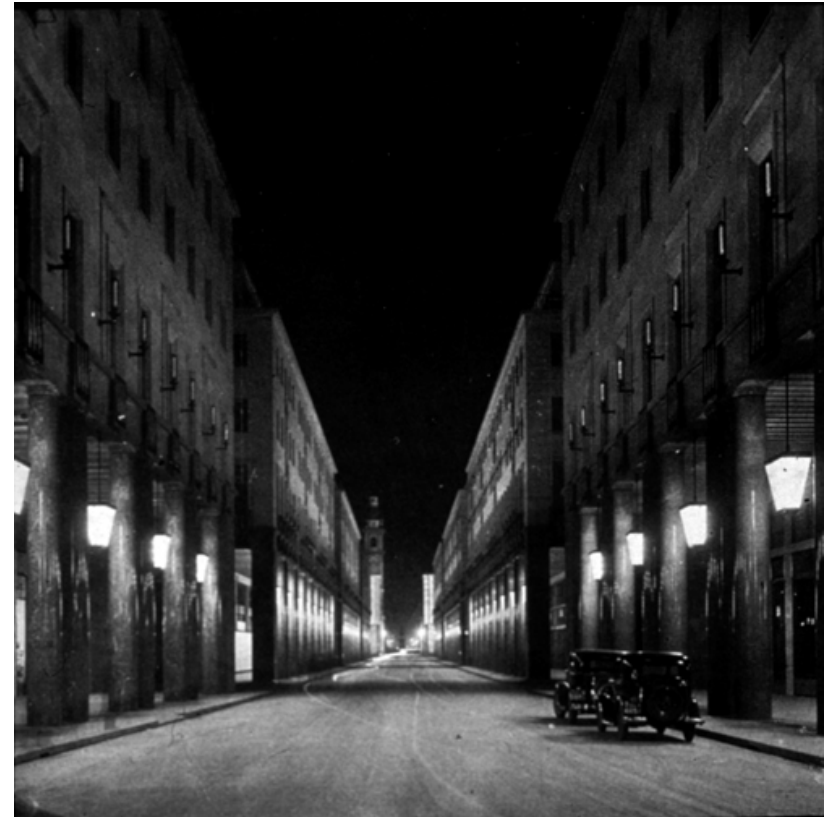
Abb. 2: Marcello Piacentini, Via Roma in Turin, 1935-37. Die Kolonnenstraße bezieht sich ebenso auf den Ruhm des Römischen Imperiums wie sie Teil der zeitgenössischen internationalen „Civic Art“ ist.