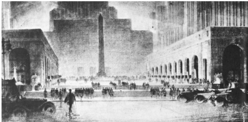
Abb. 3: Harvey Wiley Corbett, Entwurf für das Metropolitan Opera House (später Rockefeller Center) in New York, 1928. Flankierende Arkaden sollen einen Platz schaffen, der Michelangelos Kapitol in die moderne Hochhausstadt übersetzt.